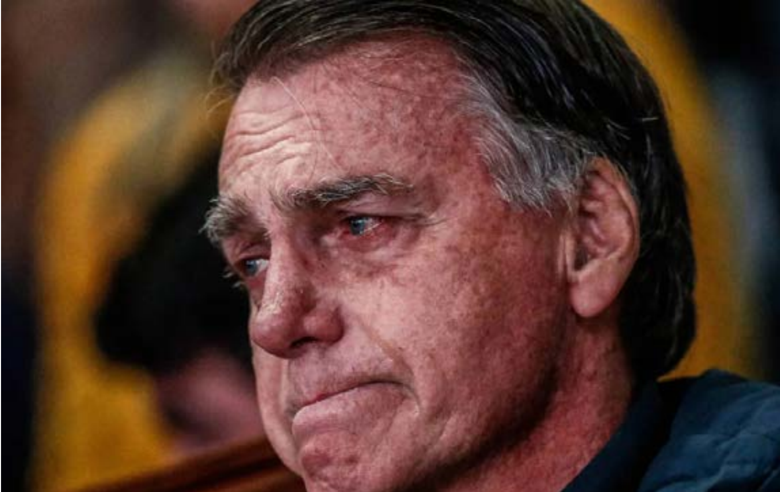
Jair Bolsonaro, expresidente de Brasil