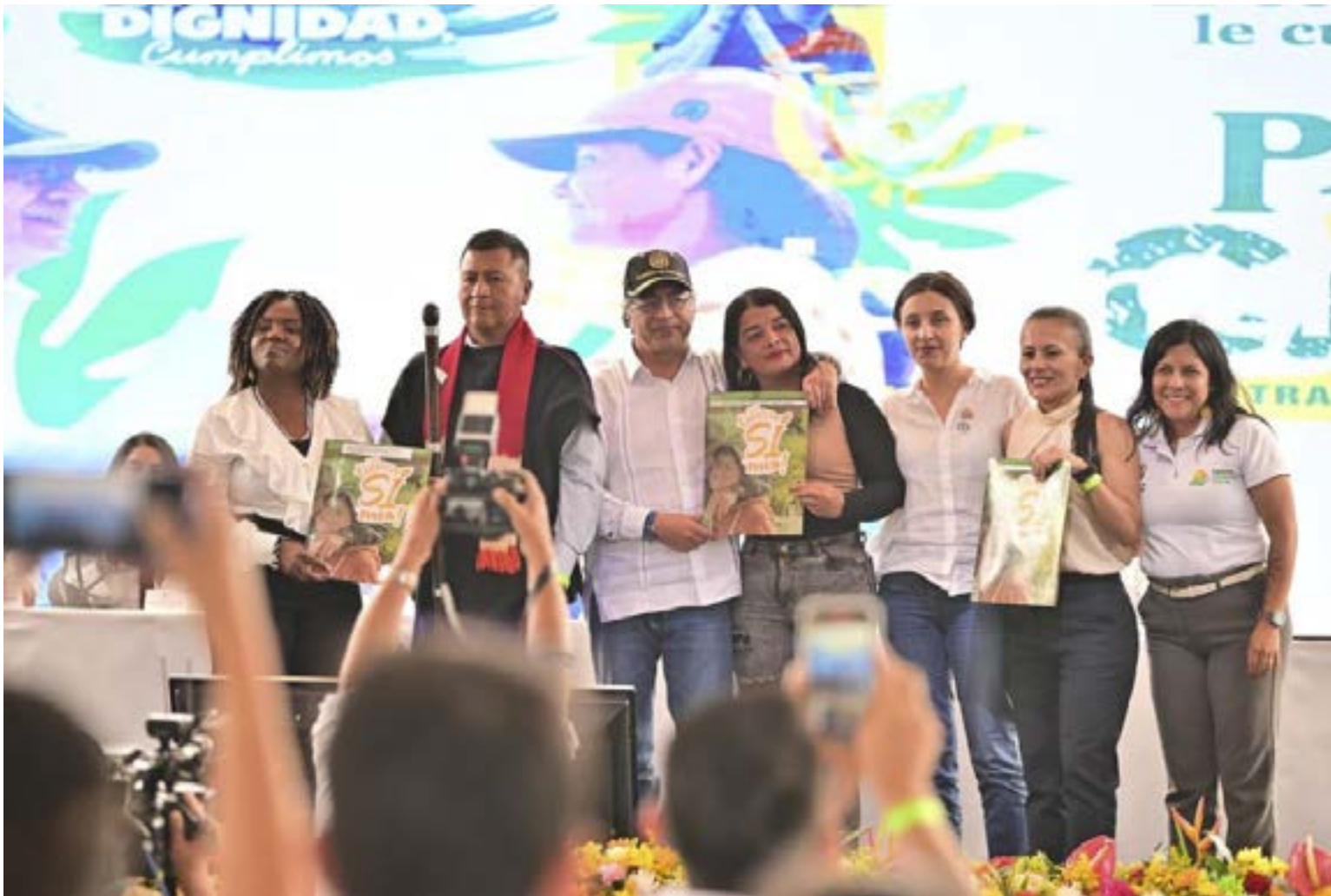
Pacto Territorial Cauca de $27,6 billones para el desarrollo del suroccidente colombiano, con $23,4 billones ya garantizados.