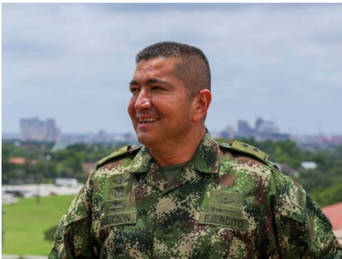
Hernando Garzón Rey, ex mayor general

En las imágenes, se observa a Garzón, en ese momento inspector general de las Fuerzas Militares, interactuando de manera cercana con los hombres armados. Agentes de inteligencia aseguran que en los videos se les escucha llamándolo «general» con familiaridad, lo que, según la versión oficial, generó sos-