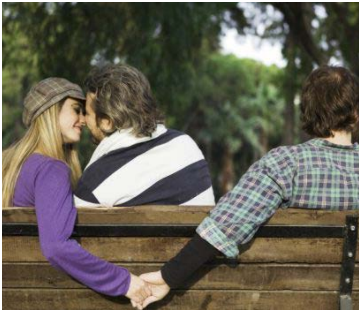
La infidelidad siempre es resultado de omisiones, falta de comunicación, abandono de la intimidad y pérdida de confianza.

Por ejemplo, ¿Me beneficia continuar con la manera de pensar que tuve