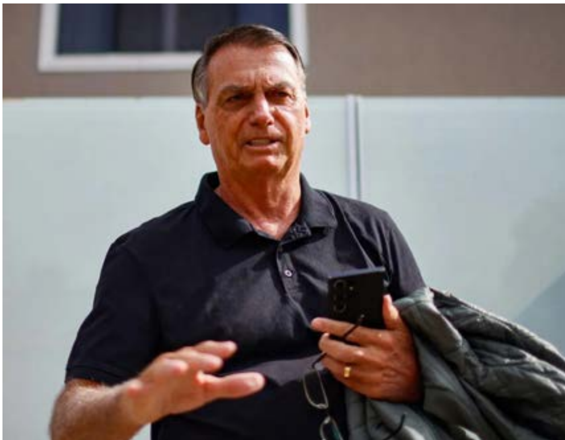
El expresidente brasileño Jair Bolsonaro fue notificado de su condena y, de inmediato, fue trasladado a prisión para cumplir su pena. Esta decisión marca un hito en la historia judicial de Brasil.

El fallo judicial se fundamenta en un meticuloso análisis de las acciones