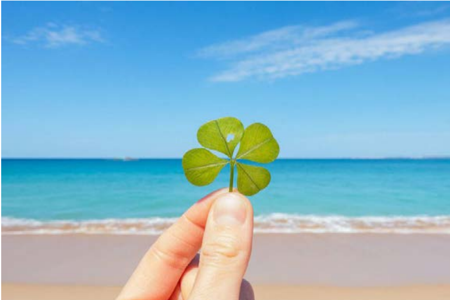
Un faro de alegrías.