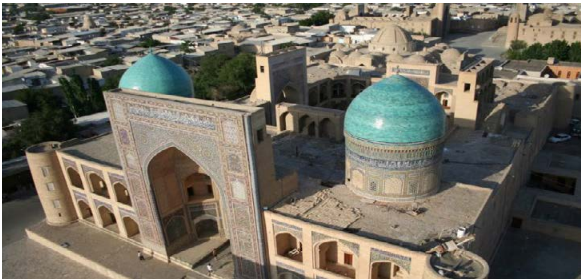
Primera universidad del Mundo la Fundó Mujer Fatima al-Fihri