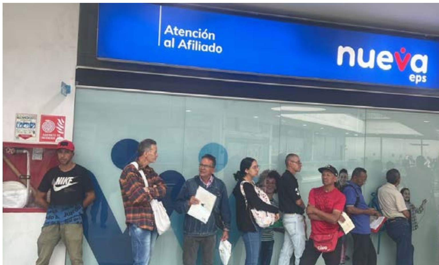
El shu -shu-shu de Petro ha cobrado la primera víctima. 13 millones de usuarios de la Nueva EPS se quedaron colgados de la brocha.

La Nueva EPS funcionó hasta cuando las cajas de compensación salieron de ser sus socias y el estado quedó de accionista mayoritario. Pero como esa entidad había sido concebida dentro del esquema de salud que Petro odiaba y su meta era que le aprobaran una reforma total al sistema y no lo pudo lograr cambiar, los 13 millones de usuarios deben pagar las consecuencias.