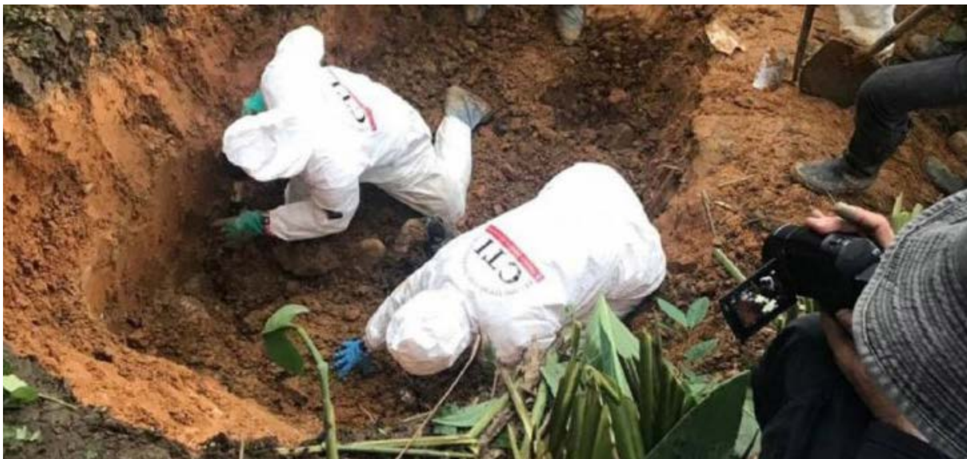
Miles de colombianos fueron encontrados en cientos de fosas comunes víctimas de los falsos positivos.