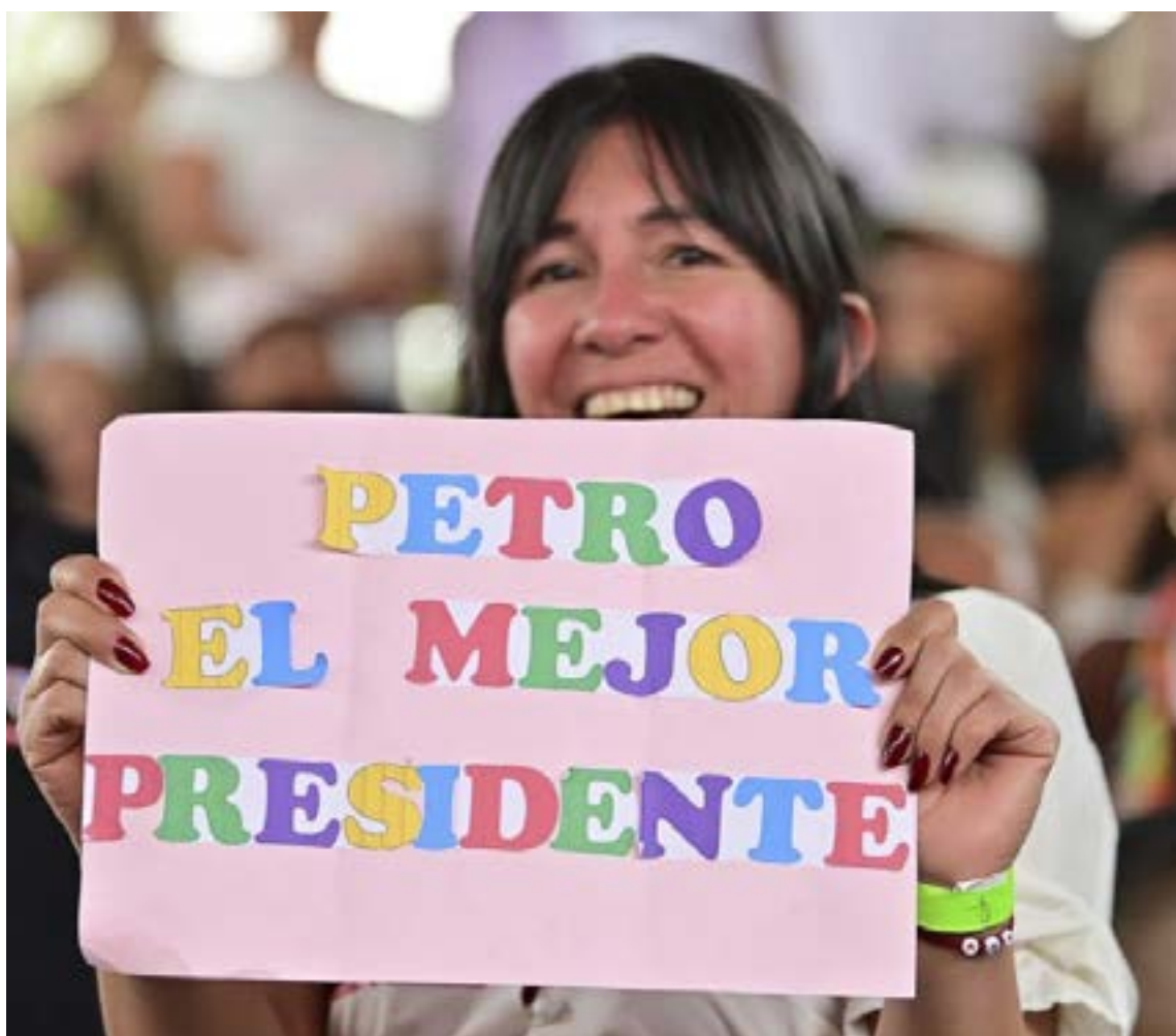
Las comunidades del Cauca reafirmaron su apoyo total al presidente Petro, celebrando que por primera vez en 50 años un jefe de Estado atiende sus mayores necesidades. La alegría en la región fue desbordante.

La inversión se destinará a 15 macroproyectos clave, sumando un total de $21,9 billones, junto con una bolsa adicional de $4,7 billones. Entre las