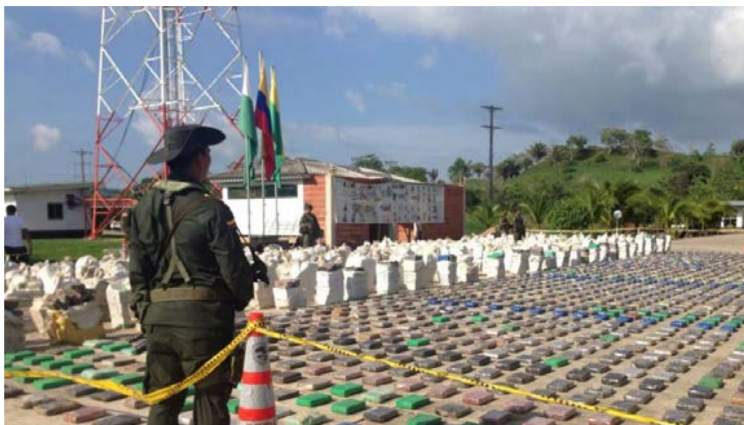
Guardacostas de Colombia y de Estados Unidos interceptaron una lancha en el Pacífico, frente a costas colombianas, decomisaron 2,5 toneladas de cocaína y detuvieron a cuatro hombres, informaron fuentes de la Armada.

El presidente Gustavo Petro, aseguró que la violencia en el Cauca y Colombia tiene que ver con el aumento del consumo de cocaína en Europa, y añadió que les da rabia que sea el presidente que más incautaciones ha hecho en la historia de Colombia.