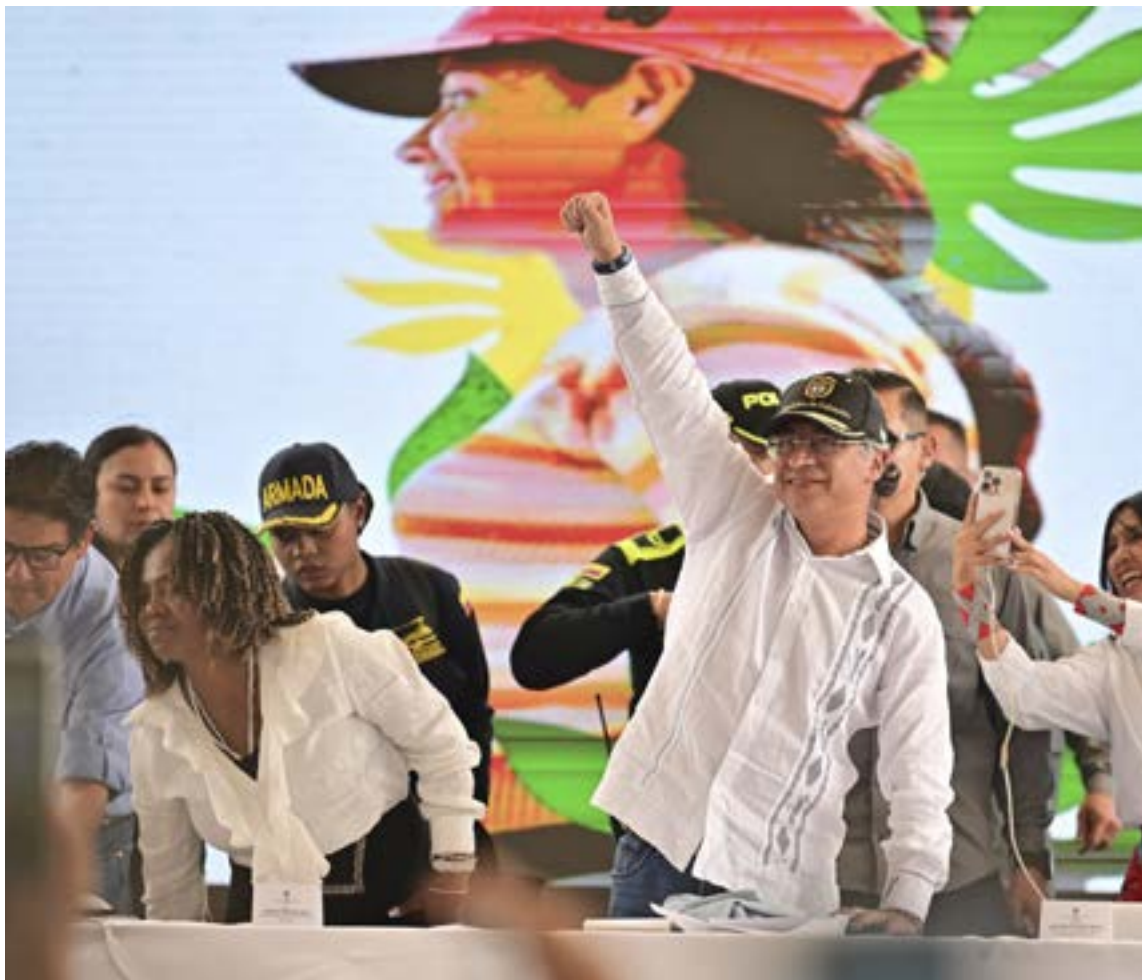
El presidente de los colombianos, Gustavo Petro Urrego en Timbio- Cauca.

Petro reiteró que su gobierno ha golpeado duramente a las redes de narcotráfico, y que la mafia, como venganza, estaría detrás de este tipo de crímenes. Esta no es