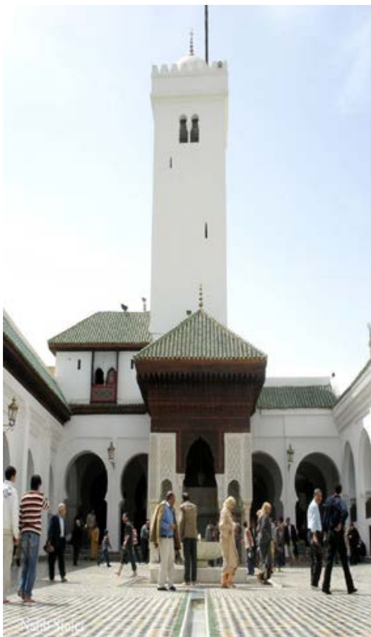
Cuando la refugiada Fatima al-Fihri fundó la Universidad de Qarawiyyin en el año 859 después de Cristo, el mundo musulmán se hallaba al inicio de los cinco siglos que duró la Edad de Oro Islámica.